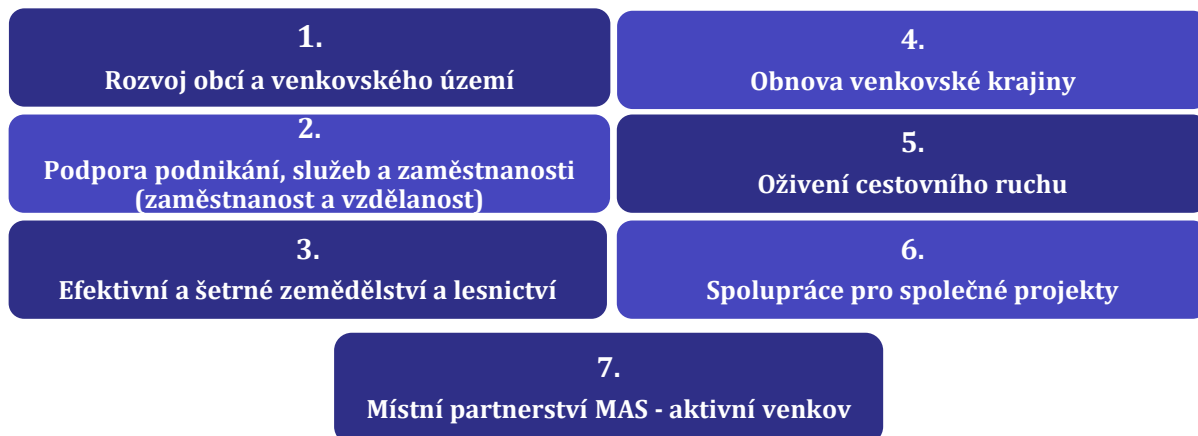
Obr. 2 Grafický přehled priorit rozvoje SCLLD MAS VaS

Prostředky pro naplňování specifických cílů jsou: spolupráce, kvalitní management, CLLD, dostupné dotační programy a vlastní finanční zdroje.